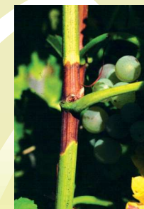
Egyenetlen fásodás