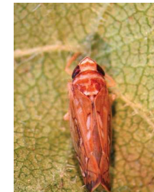
Kifejlett egyed