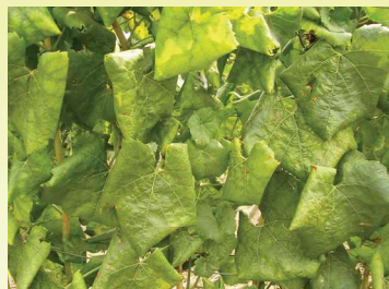
Háromszög alakú levélsodródás

A hajtásokon az első, enyhe sodródást mutató levelek a nyár közepén jelennek meg. A tünetek fokozatosan erősödnek, és kialakul a betegségre jellemző, levélszél felé történő, háromszög alakú sodródás .