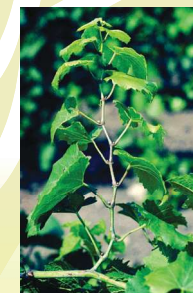
fűzők rövidülése

A beteg szőlőtőke fejlődése már tavasztól visszamarad, néha hajtások sem képződnek. A fogékony fajtáknál a fásodás elmarad , a vessző elvékonyodik és gumiszerűvé válik. Ha a tőke a tenyészidő során később fertőződik, a megindult fásodás megszakad .