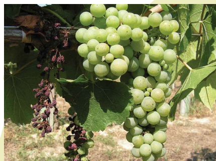
Megbarnult bogyók

A szőlő aranyszínű sárgaság a fentiekben leírt tünetek alapján nem, csak molekuláris módszerekkel különíthető el a Magyarországon gyakran előforduló Stolbur phytoplasma okozta sárgaság betegségtől (szőlő feketevevesszőjűség – bois noir).