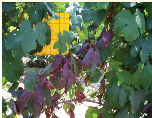
Levél vörösödés kék bogyójú fajtán

Augusztus és szeptember hónapokban a főerek mentén krémsárga foltok jelennek meg, amelyek fokozatosan terjednek a levélfelületen, végül a teljes levél elszárad . Az így elhalt, megkeményedett levelek ősszel később hullanak le , mint az egészségesek. Télen a be nem érett vesszők elfeketednek és elpusztulnak . A következő tavasszal a megmaradt rügyekből keletkező virágzat leszárad , a fürtképződés csökken. Késői fertőzés esetén a bogyók zsugorodnak, megbarnulnak , rossz ízűvé válnak.