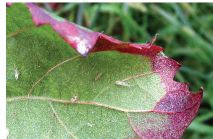
Levedlett lárvabőrök