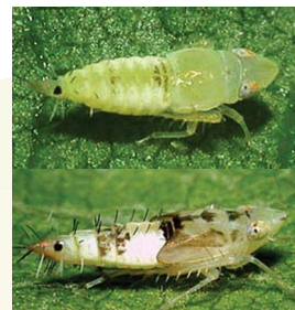
Fiatal és idősebb lárvá