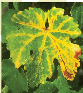
Levél sárgulás

Augusztus és szeptember hónapokban a főerek mentén krémsárga foltok jelennek meg, amelyek fokozatosan terjednek a levélfelületen, végül a teljes levél elszárad . Az így elhalt, megkeményedett levelek ősszel később hullanak le , mint az egészségesek. Télen a be nem érett vesszők elfeketednek és elpusztulnak . A következő tavasszal a megmaradt rügyekből keletkező virágzat leszárad , a fürtképződés csökken. Késői fertőzés esetén a bogyók zsugorodnak, megbarnulnak , rossz ízűvé válnak.