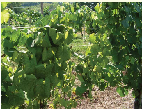
Erős fertőzés fehér bogyójú fajtán

A napnak kitett levélrészekben a fehér bogyójú fajtáknál a levéllemez részleges vagy teljes sárgulása, kék bogyójú fajtáknál vörösödése figyelhető meg. Mindkét esetben a levélfelület fémes színezetet kaphat.